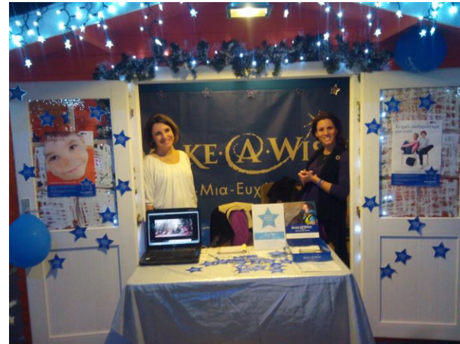
Χριστουγεννιάτικο χωριό - ΟΑΚΑ